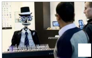
Ein Roboter mit Hut spielt auf der Hannover Messe in Hannover auf dem Stand Morsetitalia Klavier. Es geht diesmal bei der weltgrößten Industrieschau um Anlagen und Produkte, die selbstständig miteinander kommunizieren. | Foto: dpa

Die Maschinen- und Anlagenbauer in Sachsen-Anhalt drängen auf den Weltmarkt. 2013 haben sie bereits mehr als die Hälfte ihres Umsatzes mit Exporten bestritten. Bei der Hannover Messe präsentieren sie sich dem internationalen Publikum.